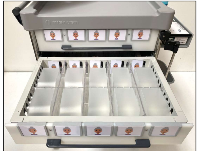
ISO DRAWER 5 PATIENTS CAJÓN ISO 5 PACIENTES