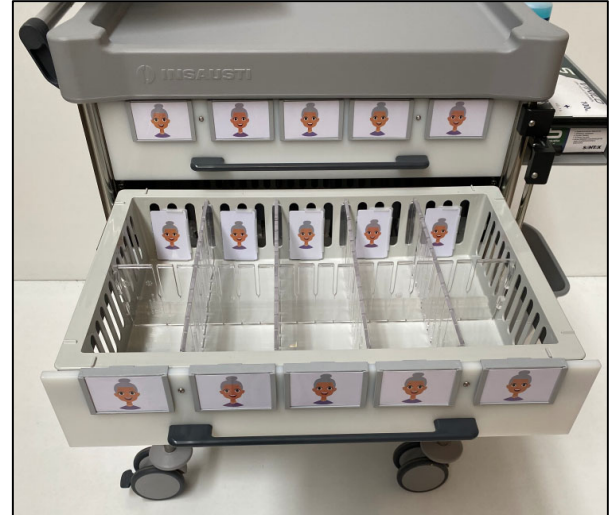
ISO DRAWER 10 PATIENTS CAJÓN ISO 10 PACIENTES