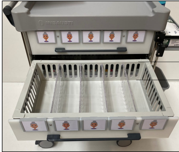
ISO DRAWER 5 PATIENTS CAJÓN ISO 5 PACIENTES